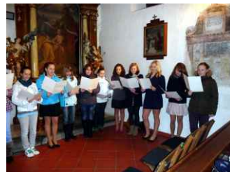
Adventní zpívání, 2012