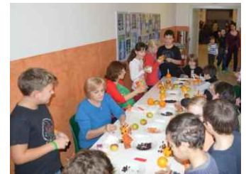
Výroba svícnů, 2013

Omalovánka Nikoloy Pilařové pro nejmenší