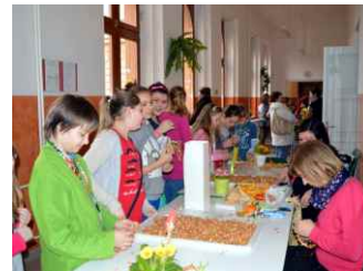
Devatero zastavení jara, 2013